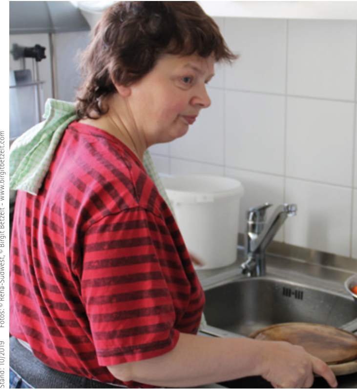
Stand: 10/2019

Volksbank eG IBAN: DE44 6949 0000 0000 0279 01, BIC: GENODE61VS1 Stichwort: „Lebensheimat“