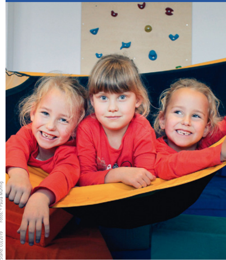
Stand: 03/2019