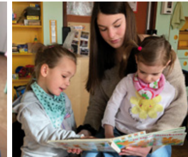
Stand: 04/2023