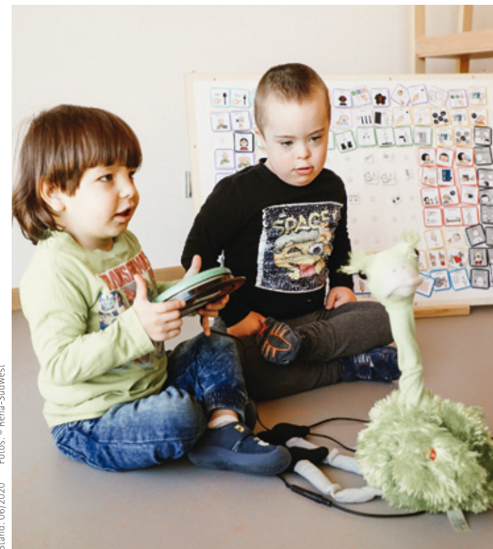
Stand: 06/2020

Reha-Südwest Ostwürttemberg-Hohenlohe gGmbH