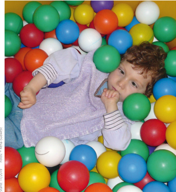
Stand: 11/2019

VR-Bank Feuchtwangen-Dinkelsbühl eG IBAN: DE74 7659 1000 0000 7530 09, BIC: GENODEF1DKV + Angabe Spendenzweck