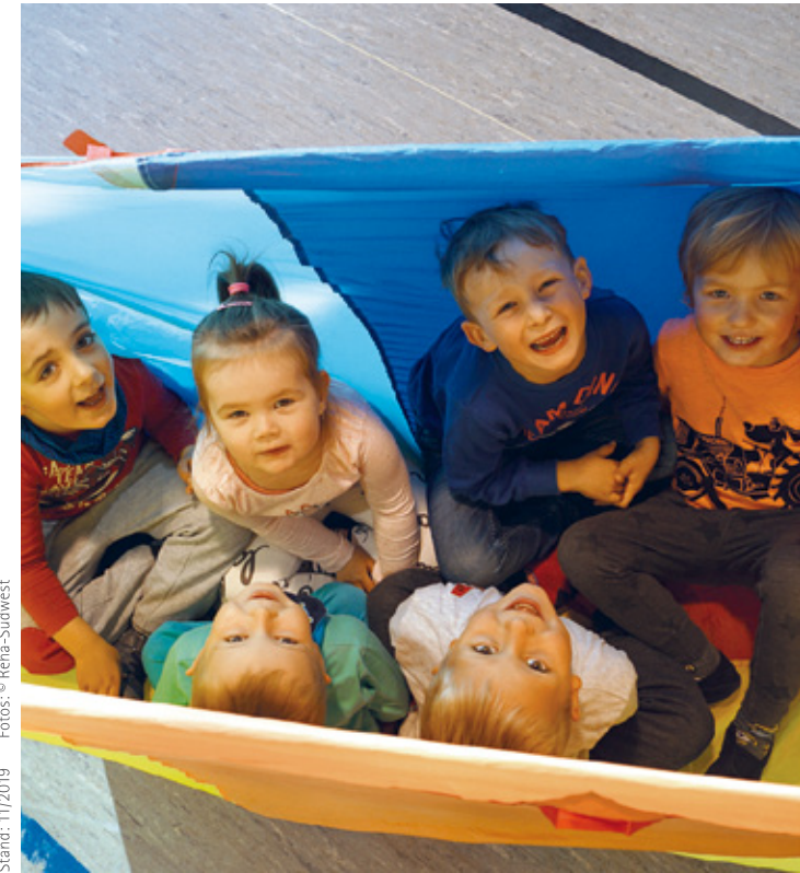
Stand: 11/2019

VR-Bank Feuchtwangen-Dinkelsbühl eG IBAN: DE74 7659 1000 0000 7530 09, BIC: GENODEF1DKV + Stichwort: „Konrad-Biesalski-Schule“