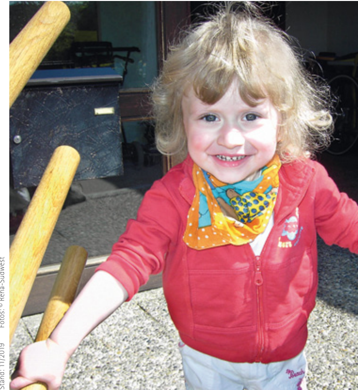
Stand: 11/2019

VR-Bank Feuchtwangen-Dinkelsbühl eG IBAN: DE74 7659 1000 0000 7530 09, BIC: GENODEF1DKV + Angabe Spendenzweck