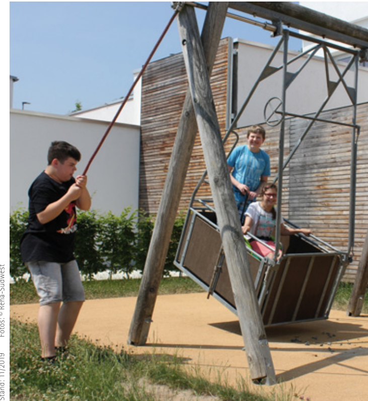
Stand: 11/2019

VR-Bank Feuchtwangen-Dinkelsbühl eG IBAN: DE74 7659 1000 0000 7530 09, BIC: GENODEF1DKV + Angabe Spendenzweck