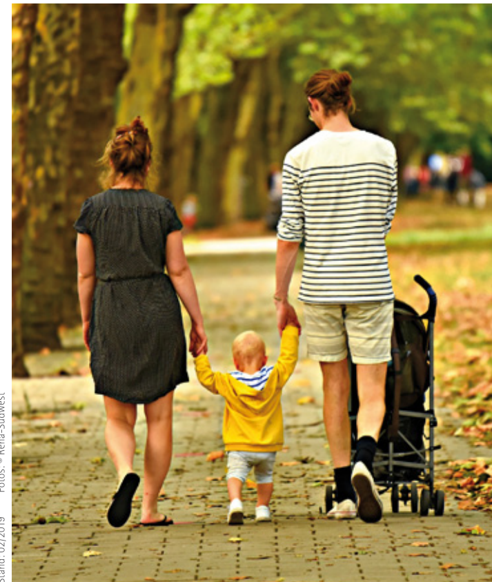
Stand: 02/2019

Bank für Sozialwirtschaft IBAN: DE81 6602 0500 0007 7300 07, BIC: BFSWDE33KRL Stichwort: „KiFaz Rastatt“