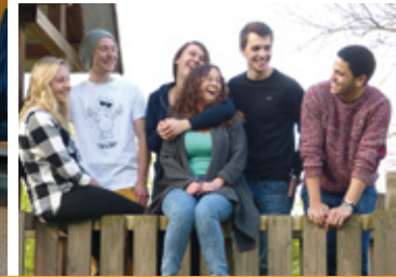
Stand: 12/2025