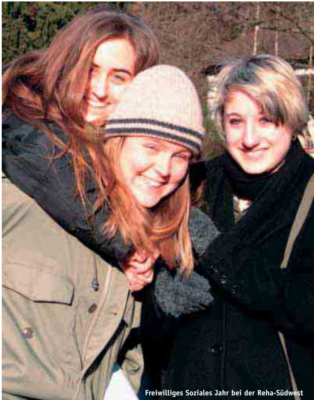
Freiwilliges Soziales Jahr bei der Reha-Südwest