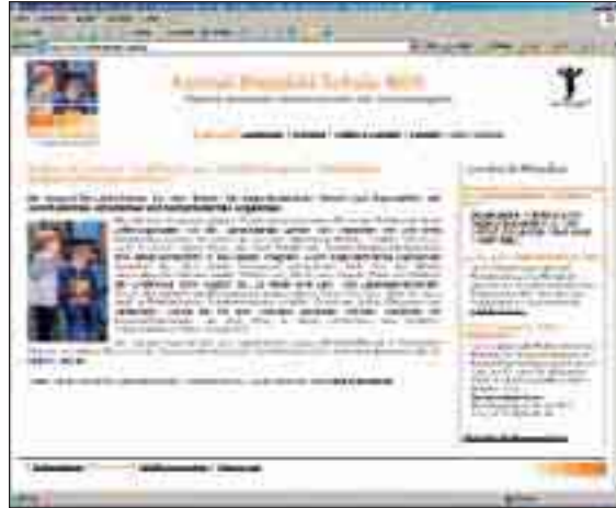
Die Startseite der Konrad-Biesalski-Schule: zu finden unter www.reha-suedwest.de/kbs .