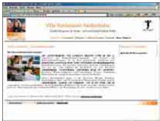
Der Schulkindergarten Villa Kunterbunt in Heidenheim hat die Internetadresse www.reha-suedwest.de/villakunterbunt .

neuen Auftritte abgewickelt. Die Seiten sind angelehnt an die allgemeinen Internetseiten des Gesamtunternehmens Reha-Südwest und sind barrierefrei, so dass auch Menschen mit Behinderungen ohne Probleme den Internetauftritt nutzen können. Das Team des Service-Centers hat auch schon für den Deutschen Paritätischen Wohlfahrtsverband in Karlsruhe ( www.paritaet-ka.de ) und dem Spastikerverein Mannheim ( www.spastikerverein-ma.de ) Internetauftritte entwickelt und gestaltet. Weitere Informationen hierzu beim Service-Center, Arbeitsplätze für Menschen mit Behinderungen, Kanalweg 40/42, Telefon: 07 21/79 07 03. ■