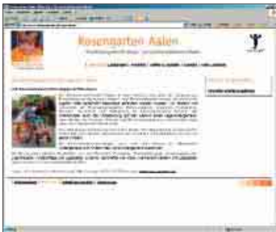
Zum Auftritt des Schulkindergartens Rosengarten geht es über die Adresse www.reha-suedwest.de/rosengarten .