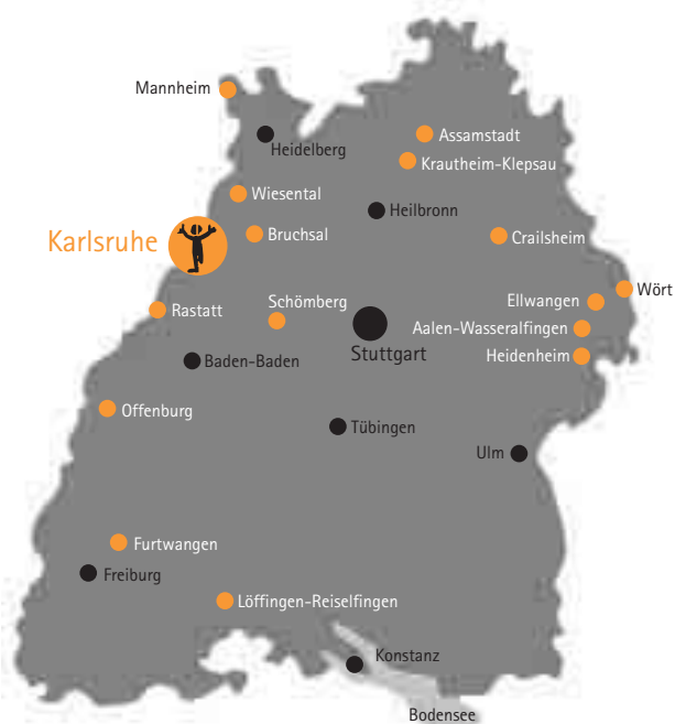
● Reha Südwest Standorte in Baden-Württemberg